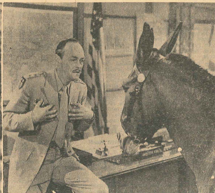
Der General ist perplex, als Francis, der Esel, zu ihm spricht